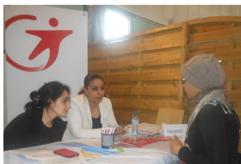
Coup de Pouce pour un Emploi Achères 10 avril 2018