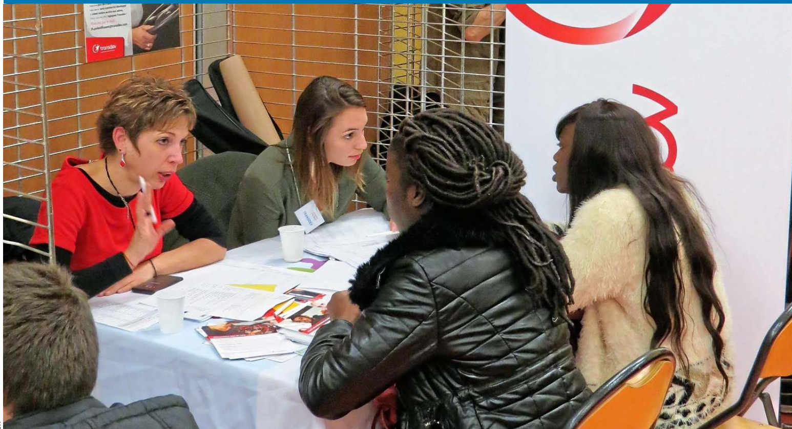
Illustration. Organisée pour la neuvième fois à Sartrouville, cette rencontre où 17 entreprises seront présentes est destinée aux jeunes âgés de 18 à 35 ans.